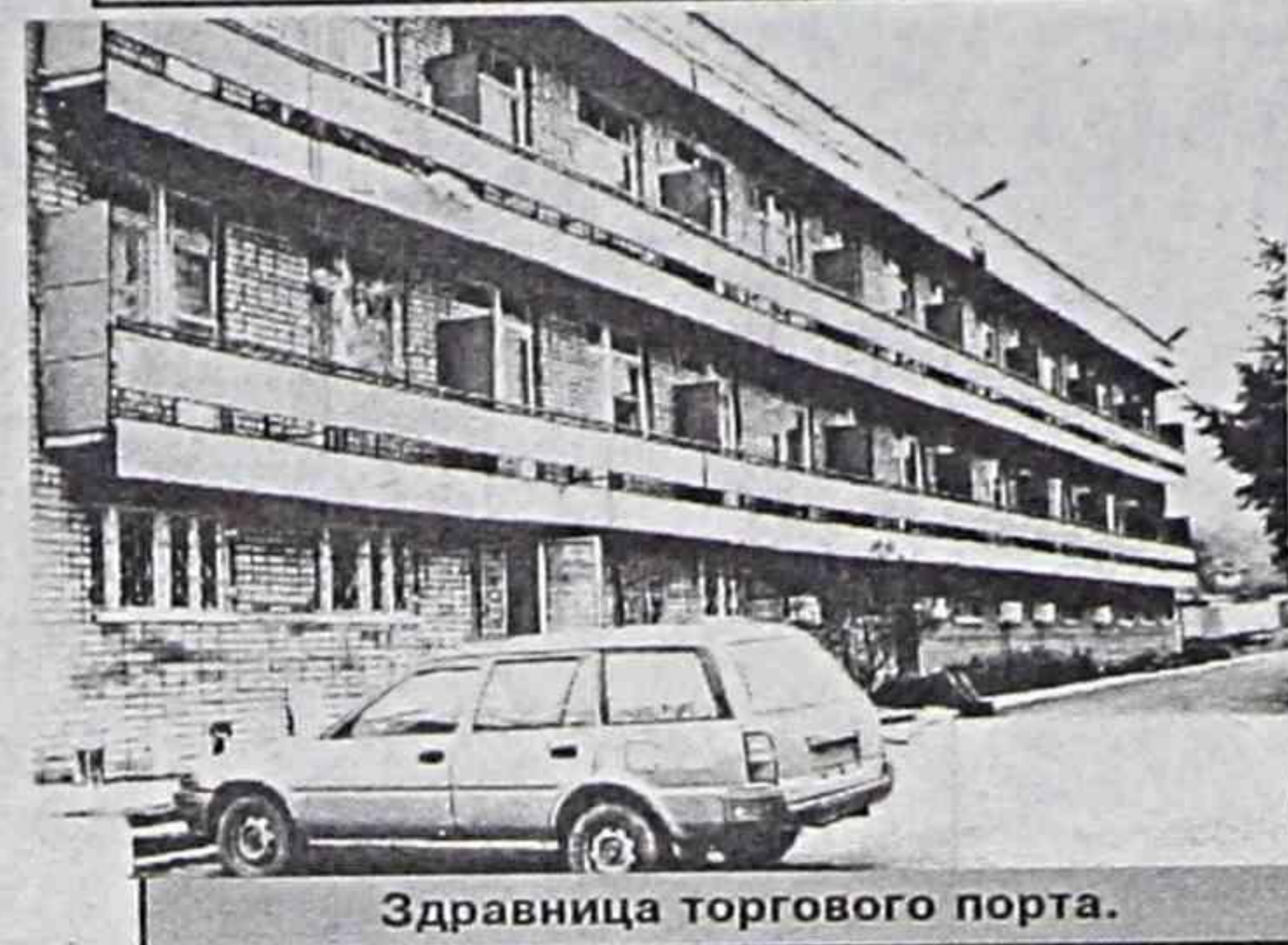
Здравница торгового порта.

Более того, в эти труднейшие годы акционерное общество вкладывает средства в обновление медицинского оборудования своей здравницы. Здесь появляются современные кабинеты, где можно лечить желудочные и кишечные заболевания минеральной водой, где лечебные грязи могут избавить человека от болезней суставов и позвоночника. А в конце прошлого года в «Жемчужном» появилась аппаратура озонотерапии, позволяющая женщинам в возрасте разгладить преждевременные морщинки или удалить жировые отложения на теле.