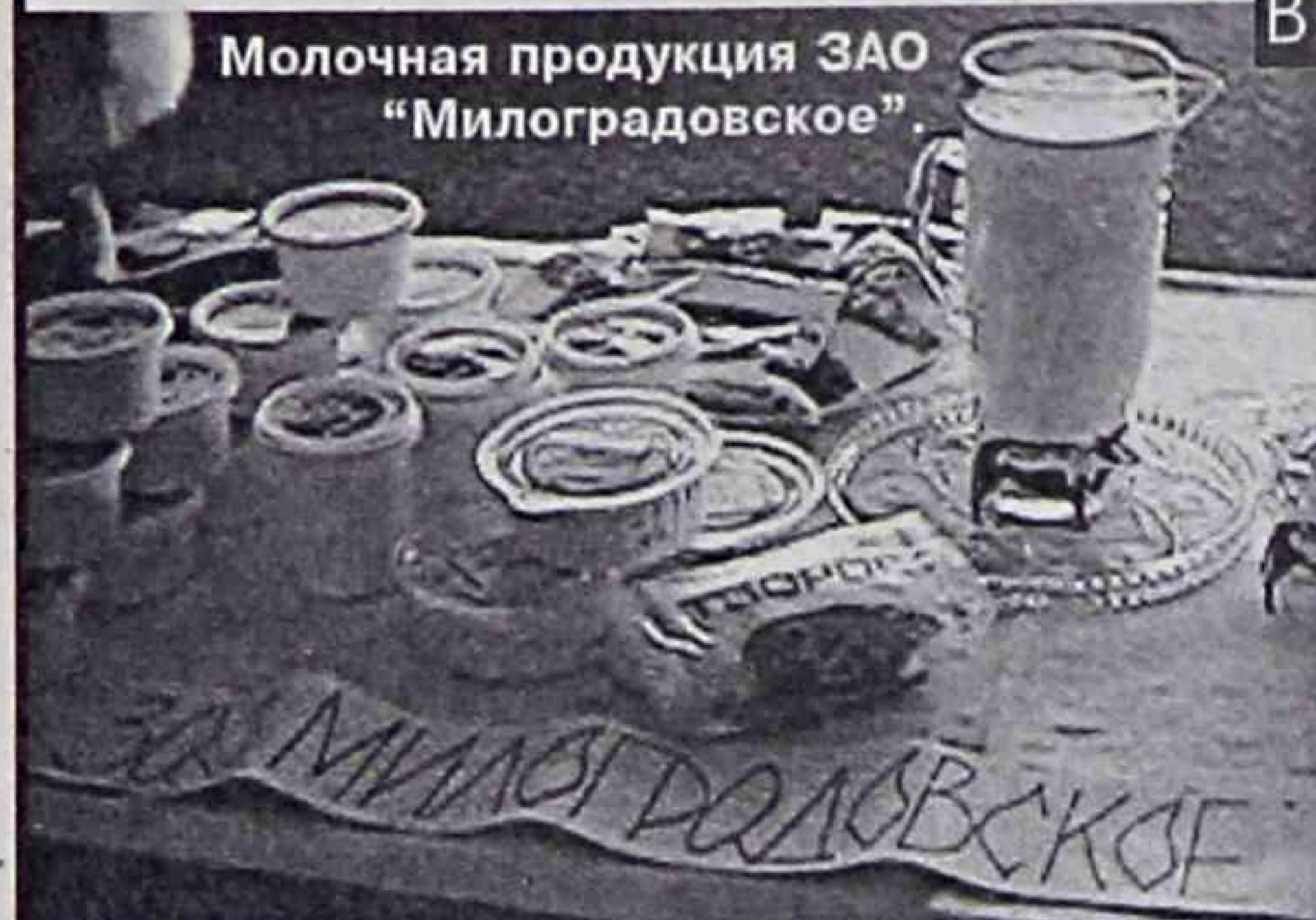
Молочная продукция ЗАО "Милоградское"