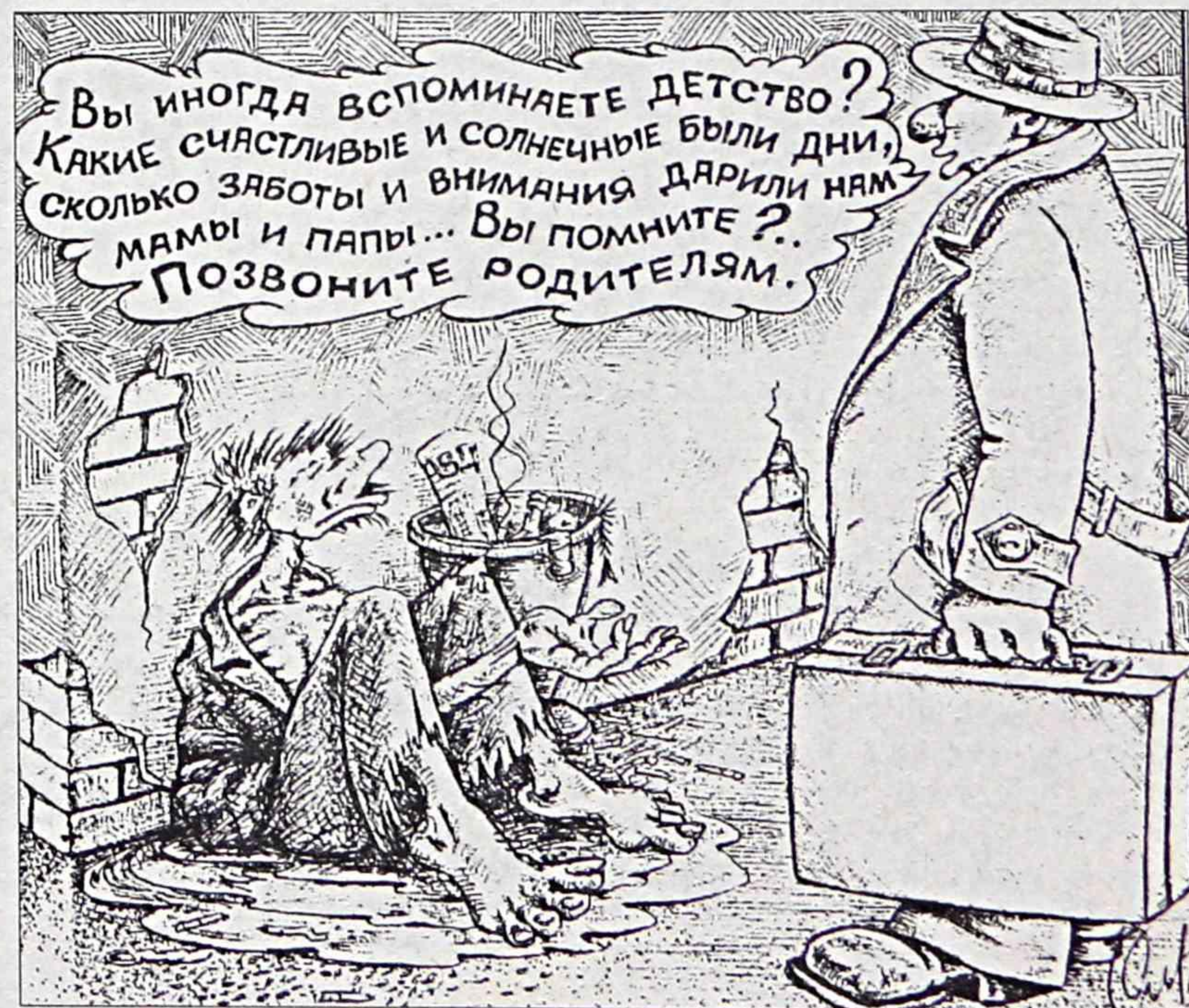
Страницу подготовил Валерий БЕЛЬЦОВ.

- В Находке плата за отопление начисляется только в отопительный сезон (7 месяцев).