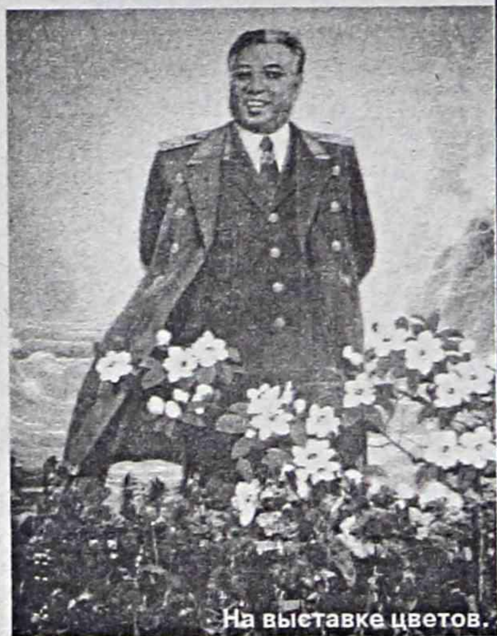
На выставке цветов.

Всего даров 214 093 и осмотреть их все можно лишь теоретически. Они поражают своей роскошью и оригинально-