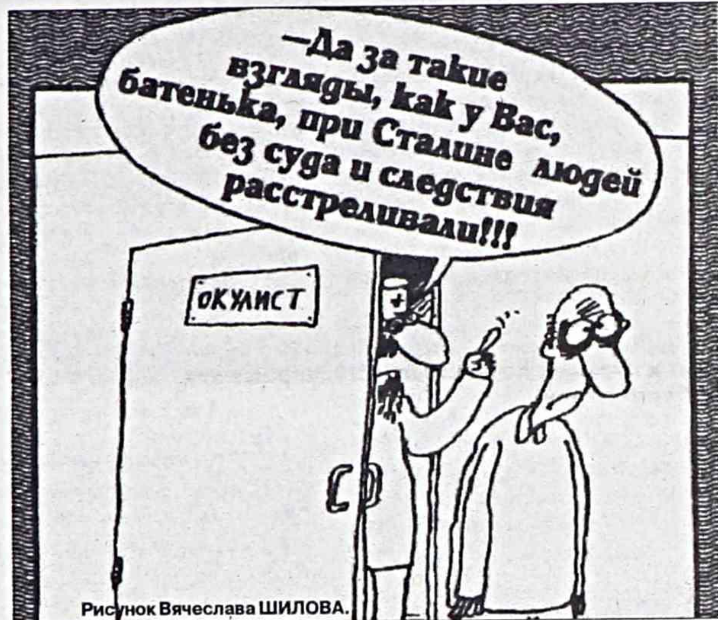
Рисунок Вячеслава ШИЛОВА.