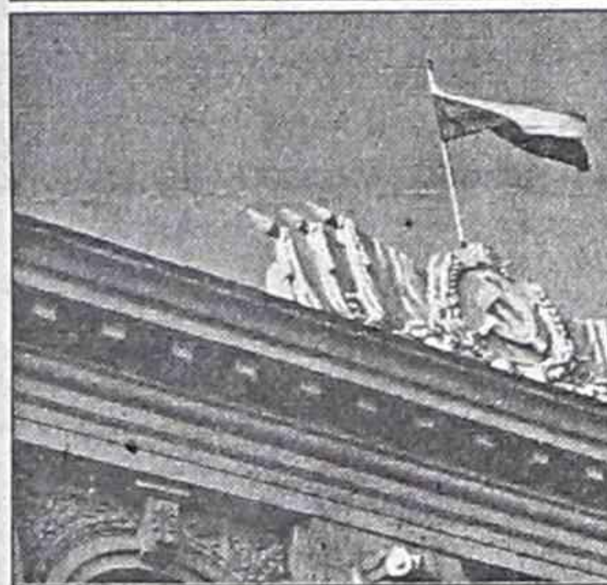
РОВНО год назад президент Путин подписал законы о государственной

символике. Находка продолжает жить под новым флагом, но со старым гербом.