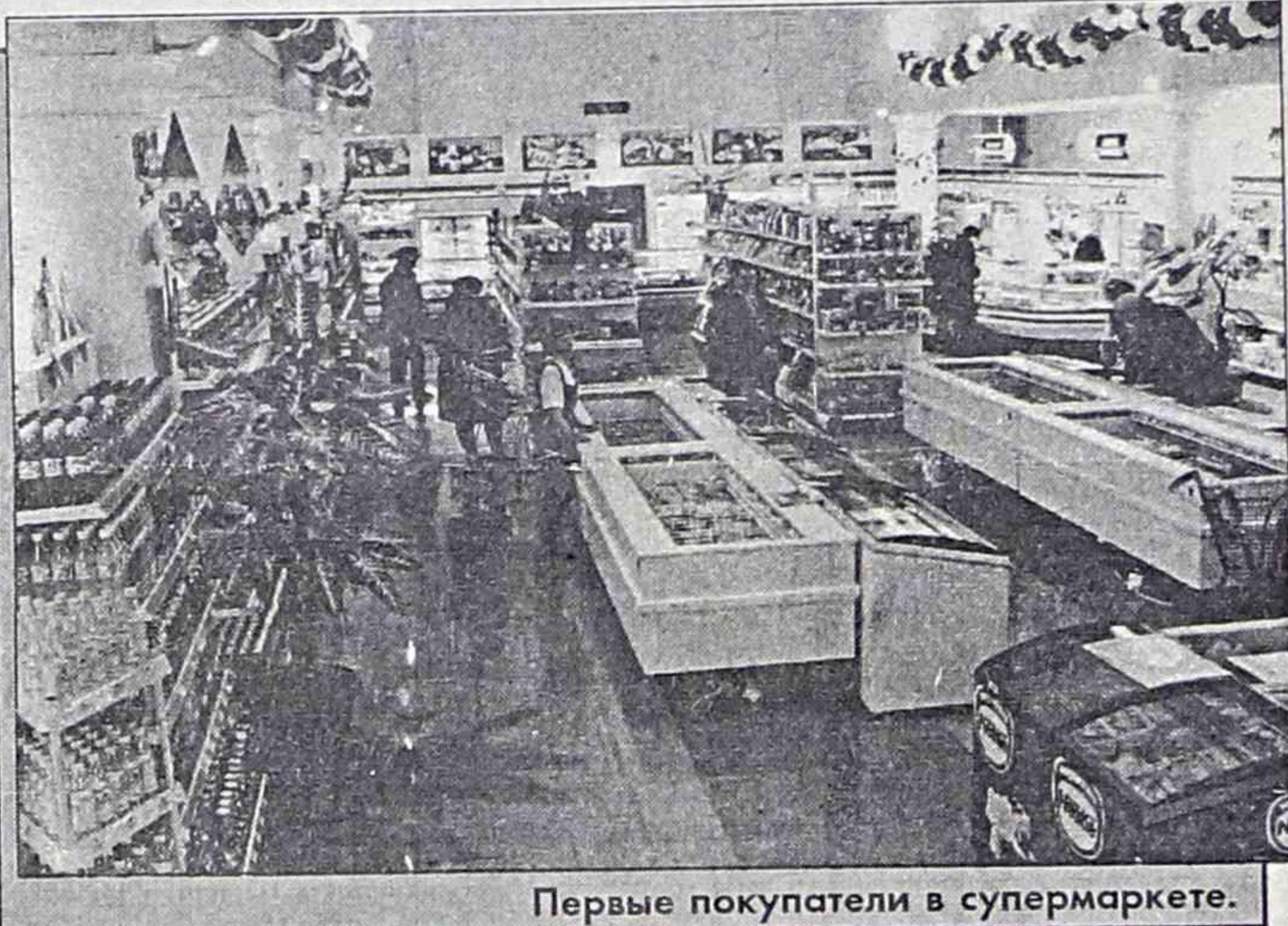
Первые покупатели в супермаркете.

Новый супермаркет круглосуточно ждет всех жителей города, для кого важно богатство выбора, доступные цены, качество и культура обслуживания. Ольга СИТНЮК.