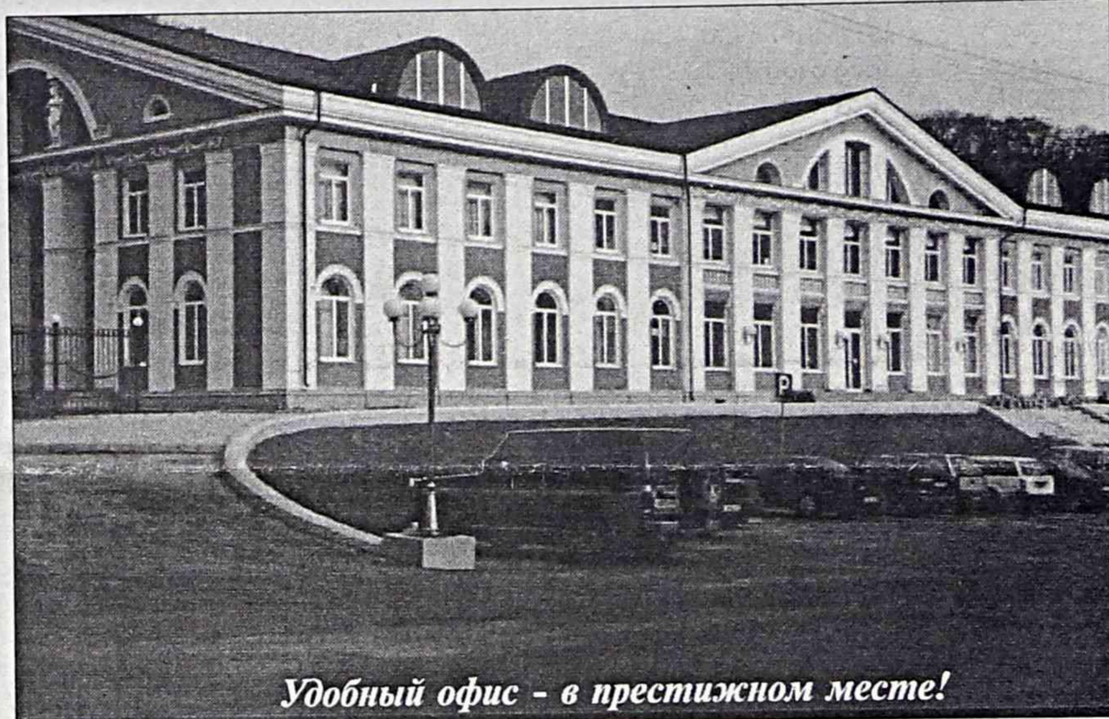
Удобный офис – в престижном месте!

Все достоинства «Колизея» уже оценили некоторые солидные компании. Так, среди самых первых арендаторов можно выделить «Даль-