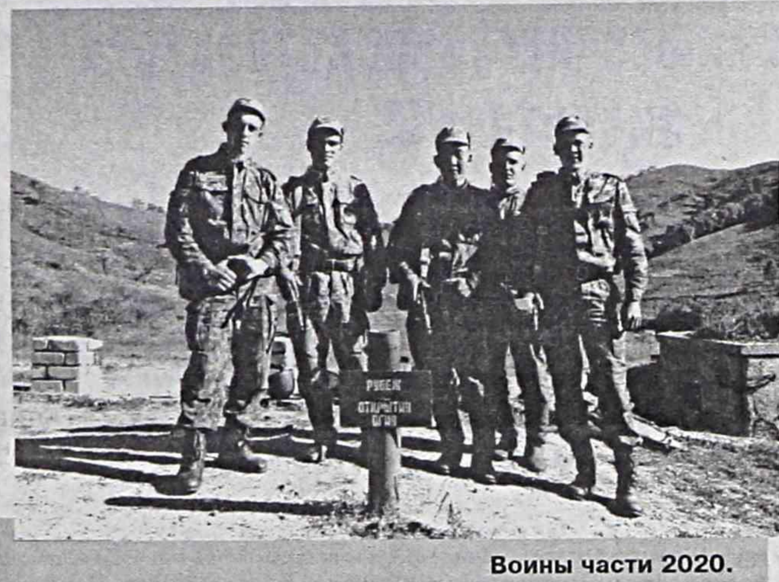
Воины части 2020.