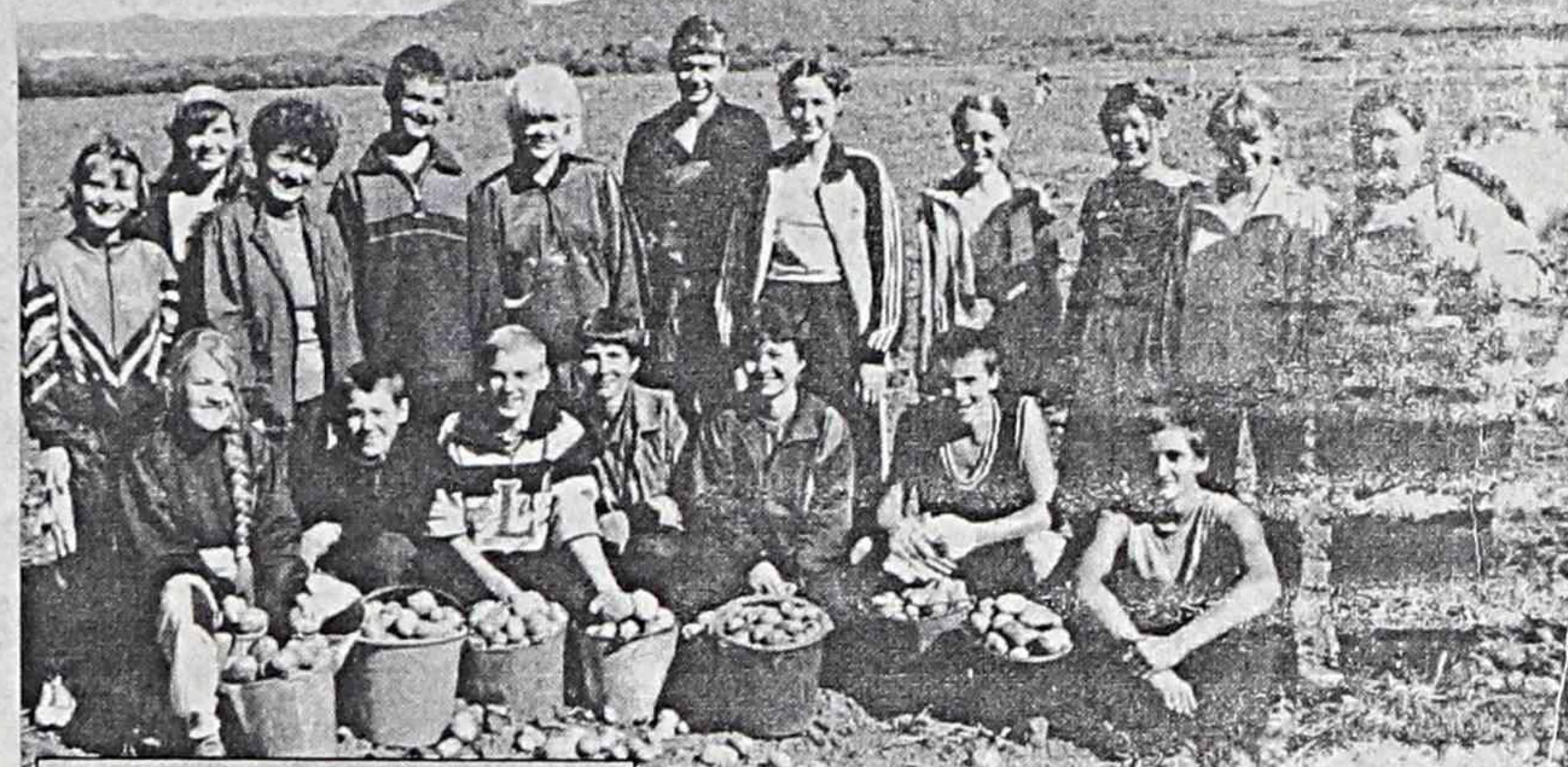
Школьники Новицкой СШ.