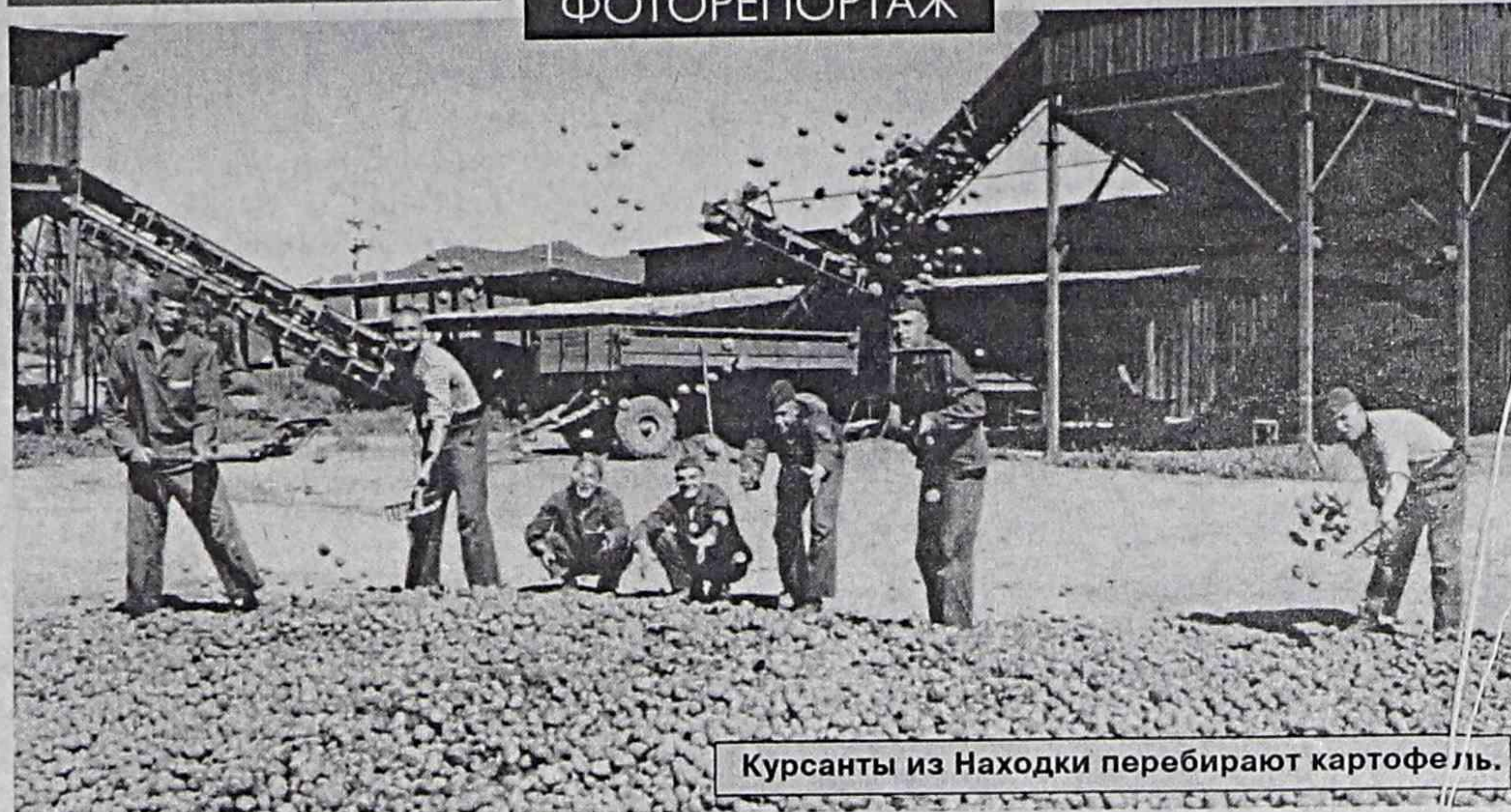
Курсанты из Находки перебирают картофель.