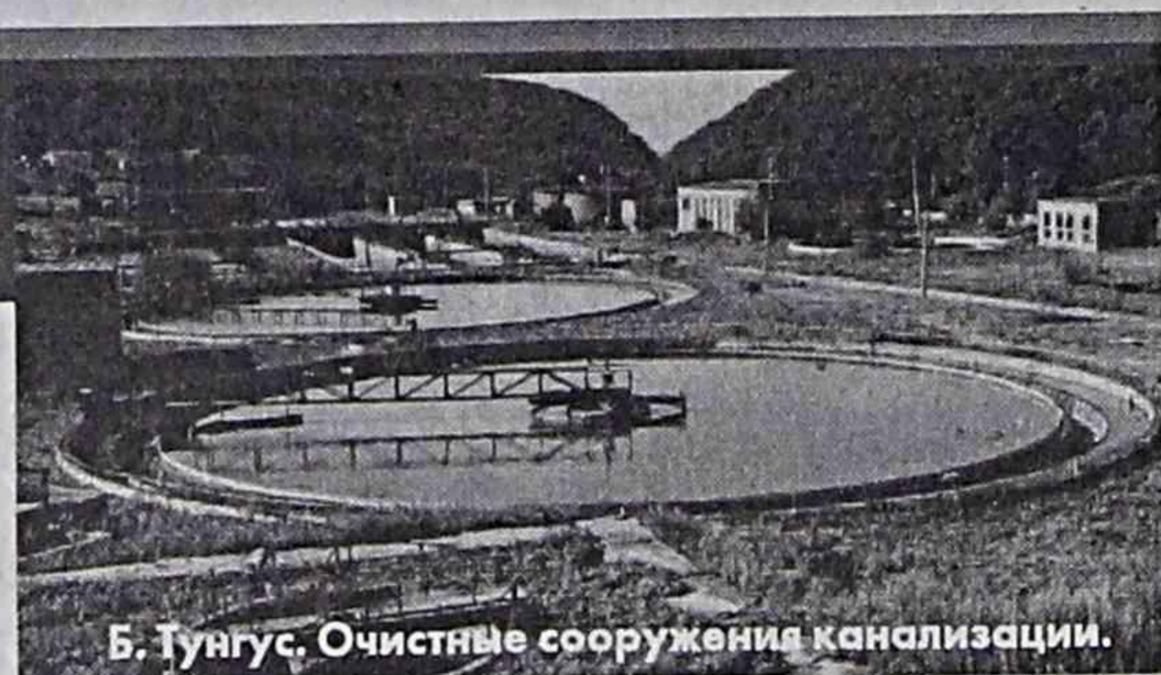
Б. Туугус. Очистные сооружения канализации.

НАКАНУНЕ юбилея мы предложили специалистам управления «Водоканал» ответить на несколько вопросов. Почему когда-то вы пришли сюда? Чем привлекает вас работа в управлении? Ваше мнение — какие меры должны принять коллектив, городские власти, чтобы обеспечить стабильную работу предприятия, а горожан — круглосуточно водой? Что бы вы пожелали коллегам в праздничный день. И вот какие ответы получили.