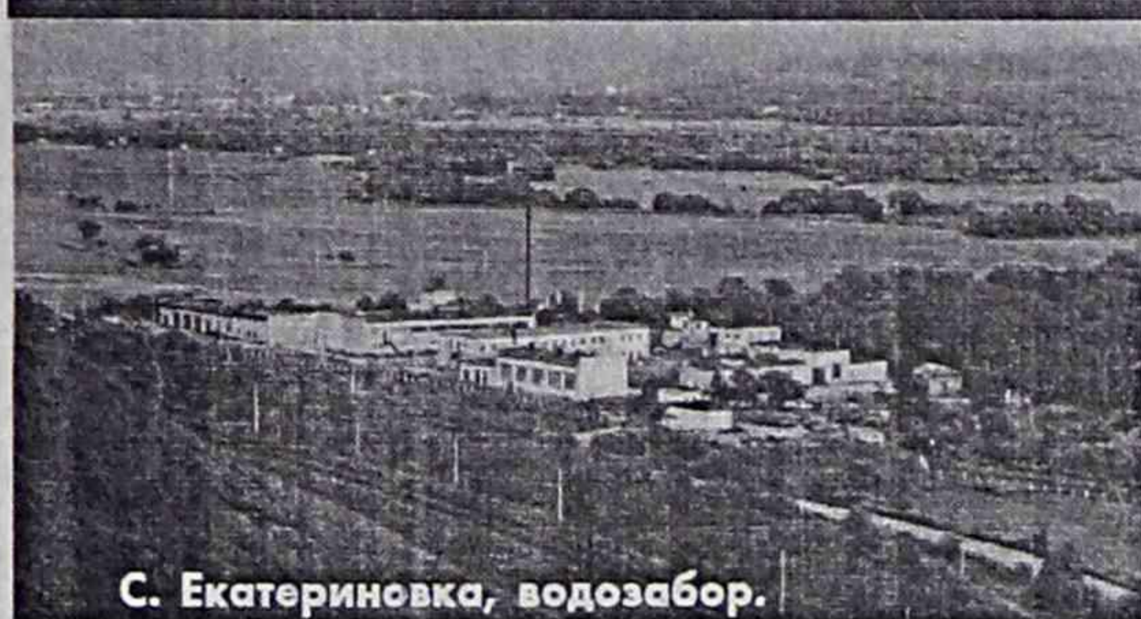
С. Екатериновка, водозабор.