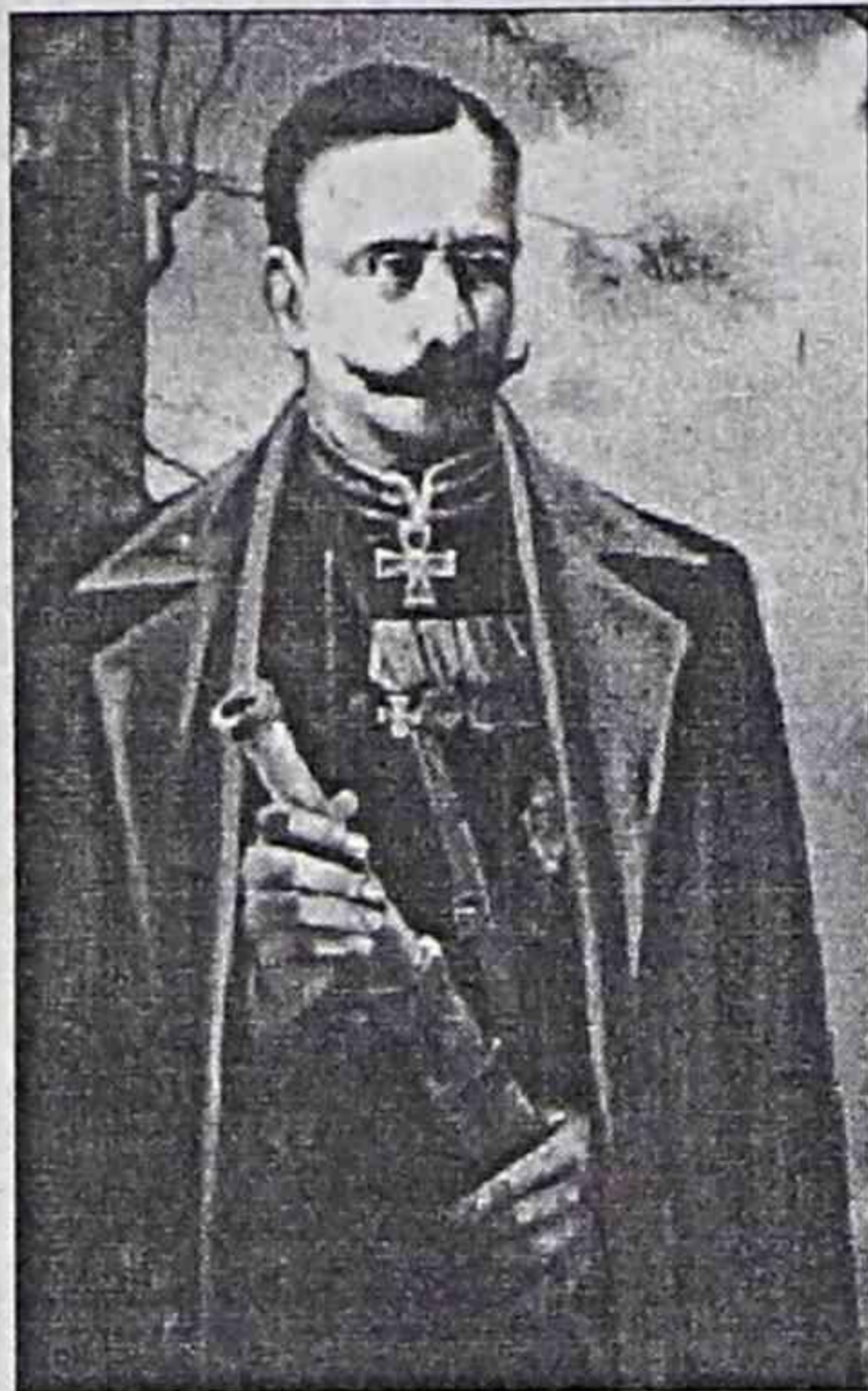
Таким видит Болтина художник Николай Саунин.

Первым шагом к созданию памятника стала презентация на морвокзале картины Николая Саунина "Капитан парохода-