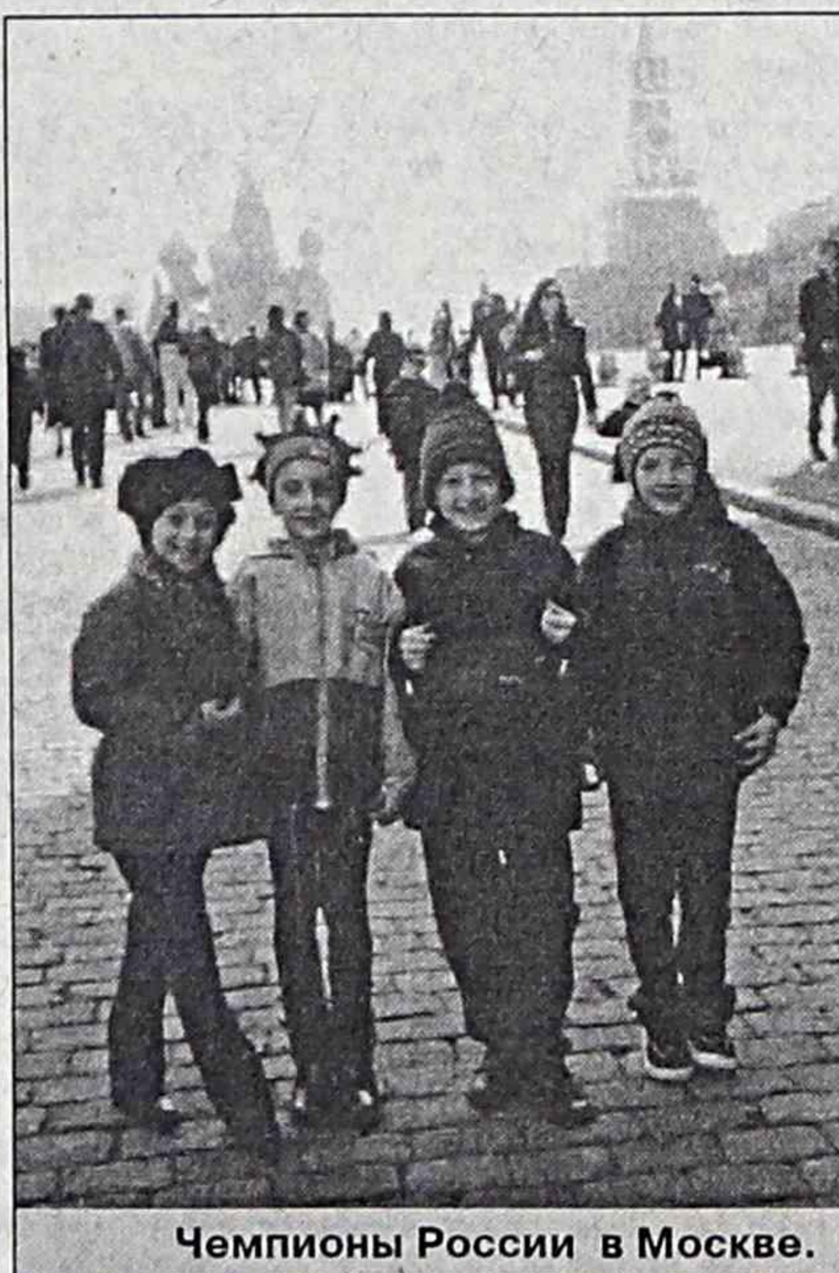
Чемпионы России в Москве.

- А в прошлые годы кто оставил яркий след в биографии ансамбля?