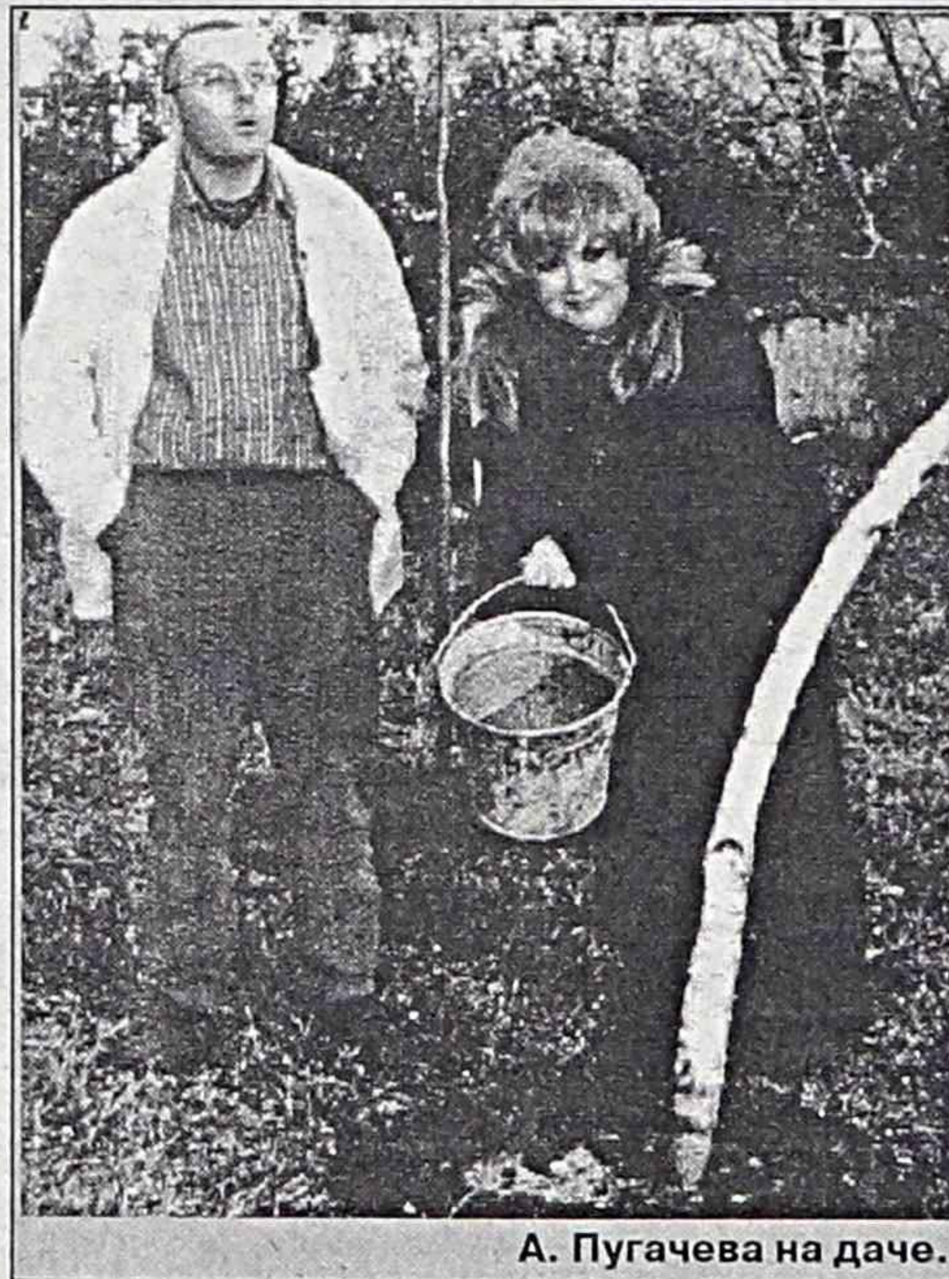
А. Пугачева на даче.

ду и фильмы, сантехнику и интерьер, на сайты и повадки теперь диктуют моду на садовые растения. По радио, в газетах или по телевидению рассказывают про Аллу Борисовну, которая, кажется, в последние годы сама только поет — остальное за нее делает многочисленная прислуга. Но за растущим на ее даче дроком она ухаживает собственноручно. Михаил Боярский знает, что андромеда — это не только созвездие, но и растение из вересковых. Владимир Жириновский — тоже очень известный ботаник. Ведущий телепередачи посоветовал ему посадить живую изгородь, чтобы лет через 10, когда его неистовый темперамент охладится, верхушки кустов закрыли колючую проволоку, по которой проходит ток. Неутомимый брат-журналист то парится в баньке Ольги Аросевой, то качается в гамаке молодого кумира Децла, то ищет луковицы галантуса (первые весенние подснежники) для нобелевского лауреата Жореса Алферова... Никаких разговоров