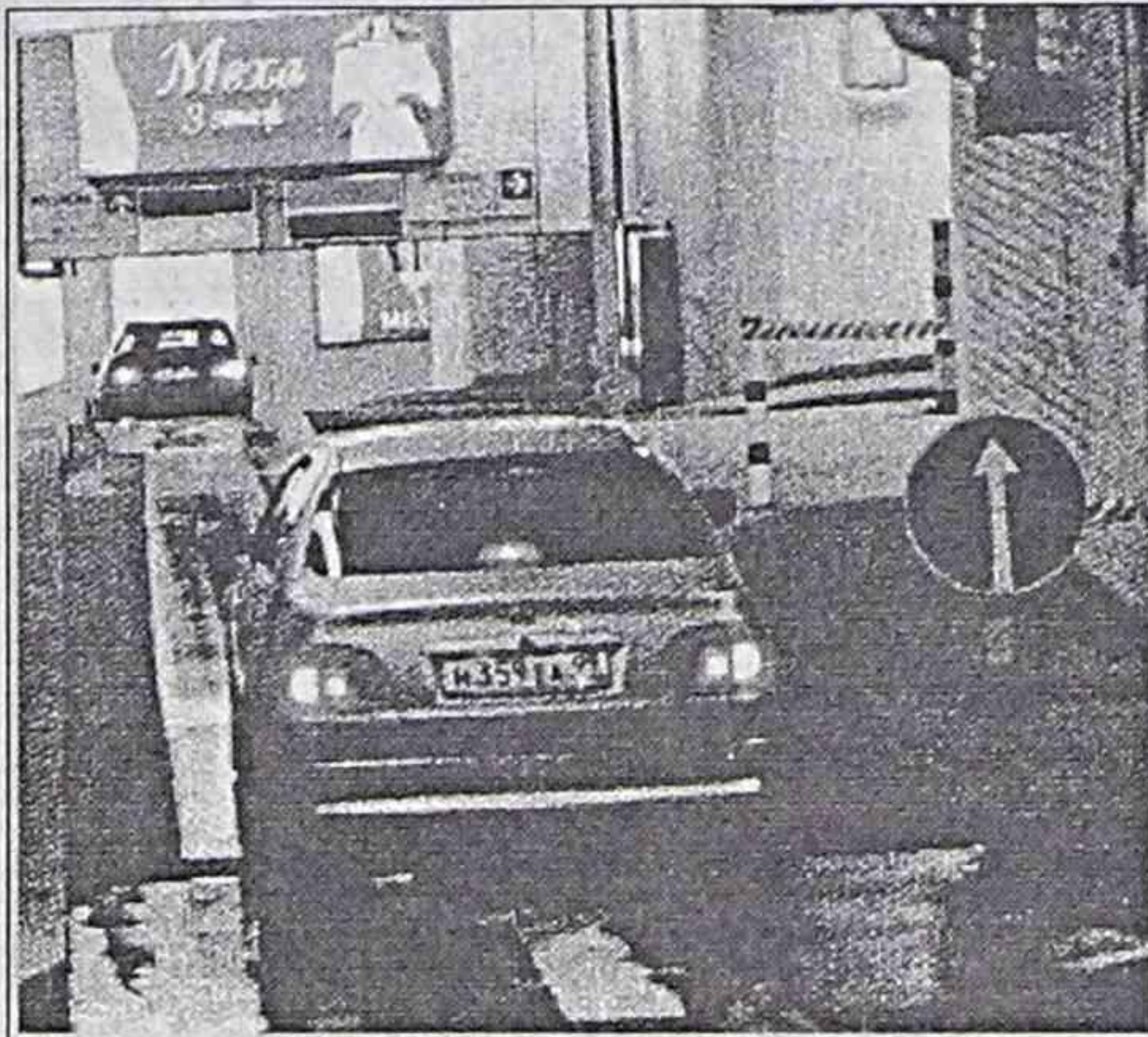
Подземный паркинг рядом с «Манежем».

Если театр начинается с вешалки, то вокзал — с багажной тележки. Не напрягайтесь. Вы не вспомните в Находке очертания этого немудреного предмета. На Ярославском вокзале прокат такой штуковины стоит от 200 рублей и выше, в зависимости от количества сумок. Даже если у вас хватит сил и сноровки докатить свои вещи от вагона до стоянки такси, парни внушительных габаритов все равно не позволят вам трепать государственное имущество. Заплати и катайся! И сразу становится ясно — вот она, ежеминутная компенсация за право дышать столичным воздухом, любоваться ее великолепием, пользоваться всеми благами коренных обитателей.