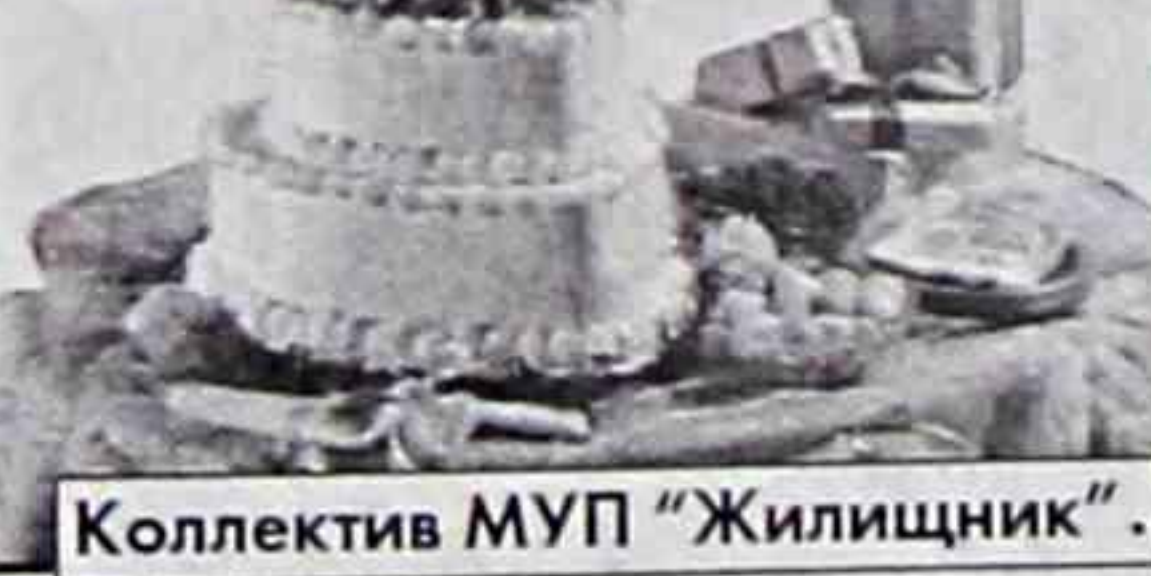
Коллектив МУП «Жилищник».

Вам желаем мы тепла и света. Не грустить - еще не та пора, Долгого и солнечного лета, Радости, веселья и добра.