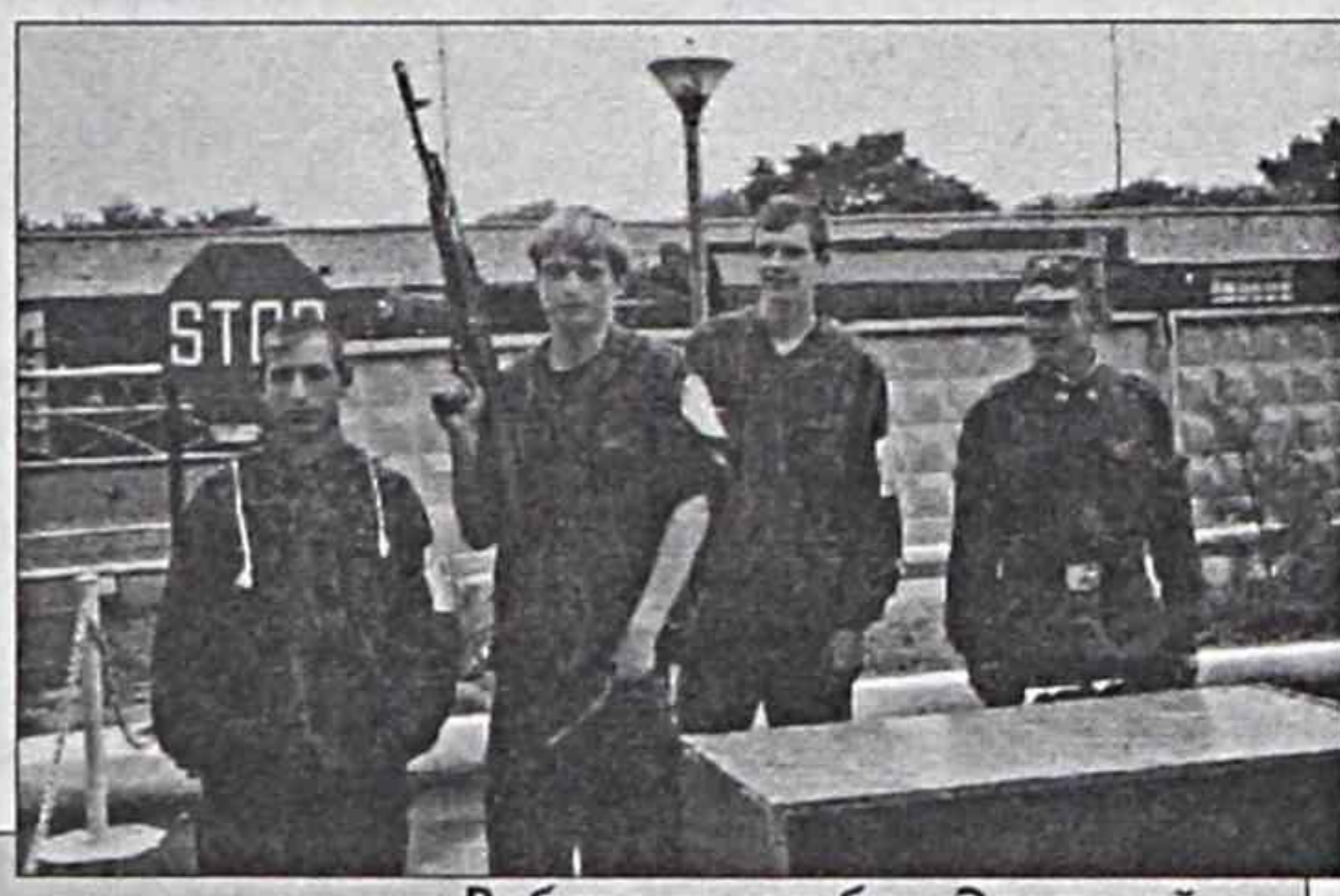
Ребята из клуба «Эдельвейс».