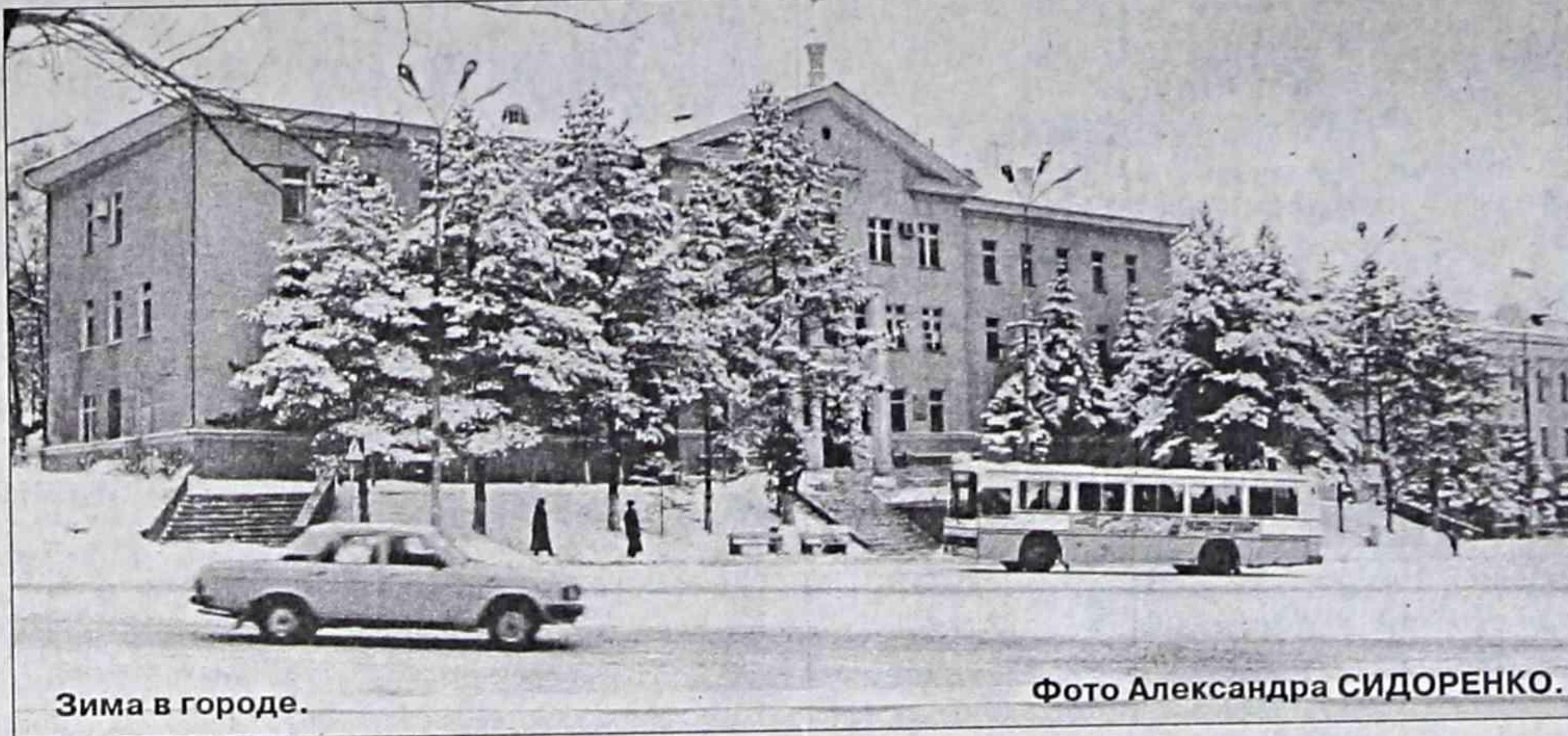
Зима в городе.