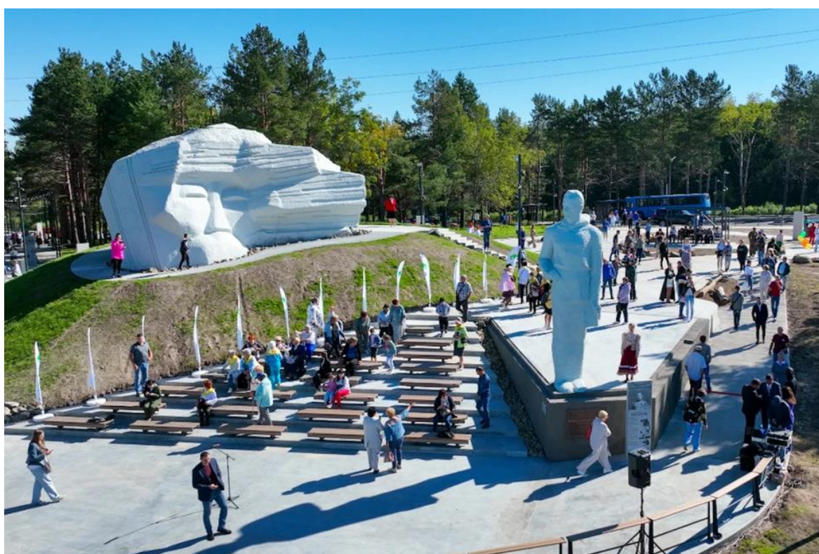
Рис. 4. Город Арсеньев. Видовая площадка имени Владимира Арсеньева и Дерсу Узала