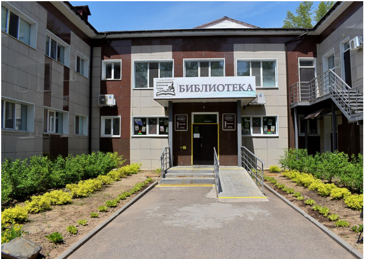
Рис.7 г. Арсеньев, МБУК ЦБС имени В. К. Арсеньева