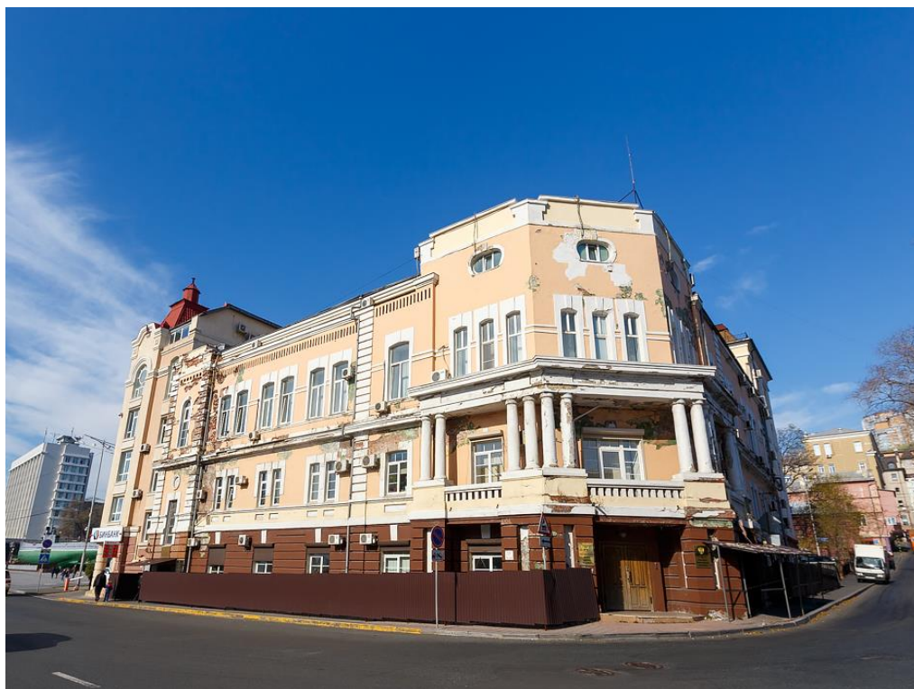
Рис.1 Дом, в котором в 1919-1925 гг. жил В. К. Арсеньев