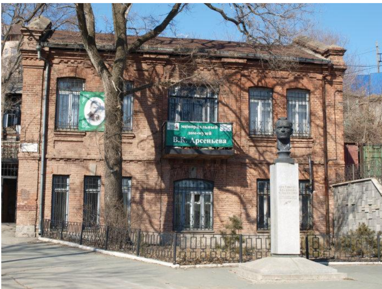
Рис. 10 Дом путешественника Арсеньева, г. Владивосток