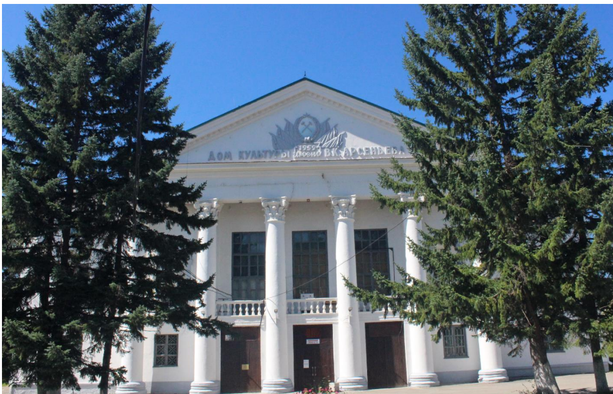
Рис.9 Дом культуры им. В.К. Арсеньева, пгт Кавалерово