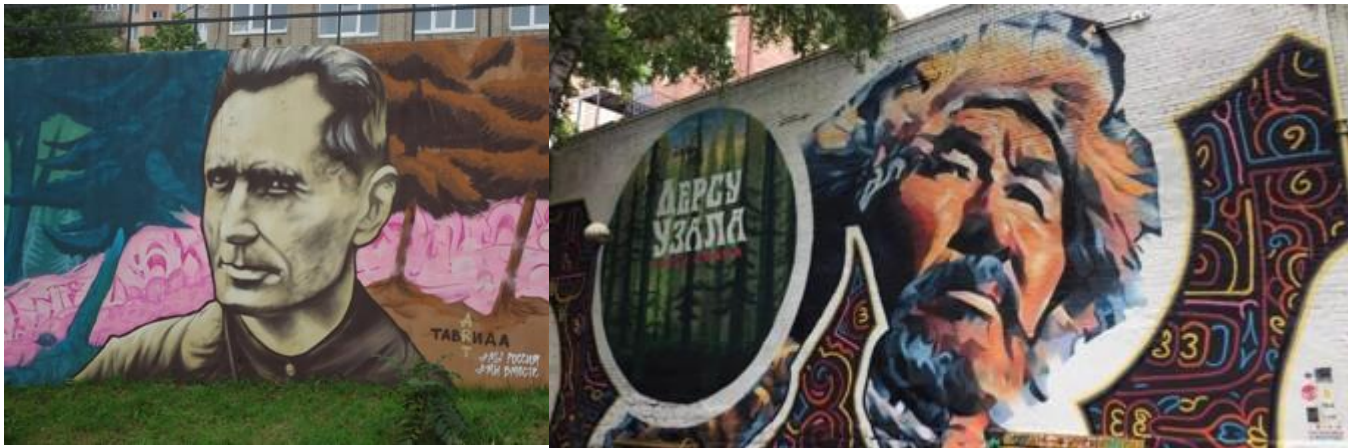
Рис.8 Граффити «Разговор у костра», г. Владивосток