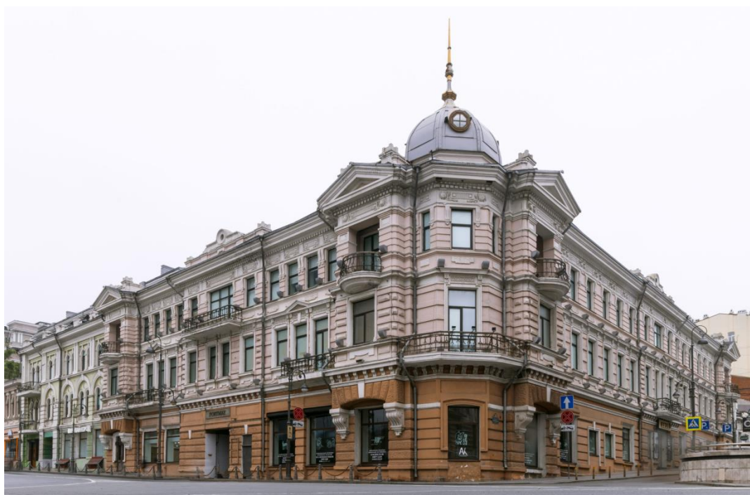
Рис.2 Музей истории Дальнего Востока имени В. К. Арсеньева