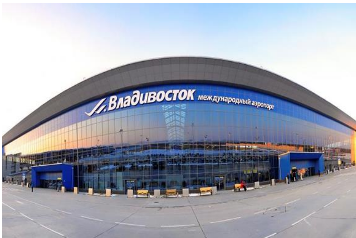
Рис. 3. Международный аэропорт Владивосток (Кневичи) имени В. К. Арсеньева