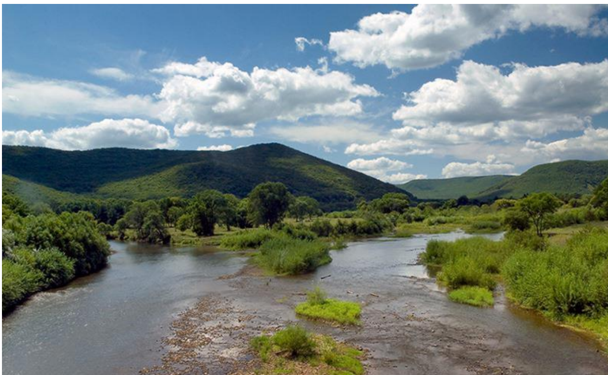
Рис.5 Река Арсеньевка