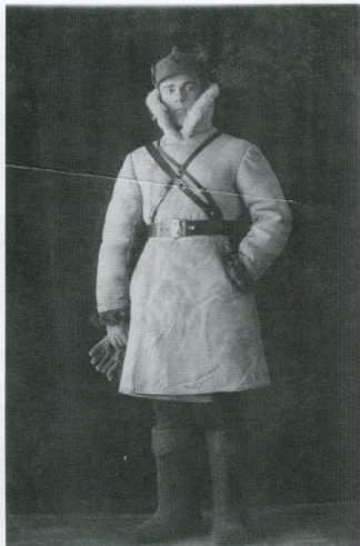
Перед отправкой на карело-финский фронт, 1940 г.