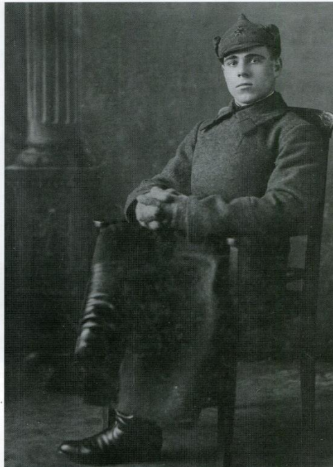
г. Омск, декабрь 1942 г.