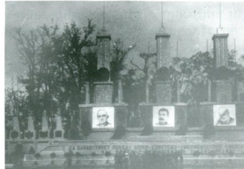
Арка Победы в Берлине, июль 1945 г. Сталин, Рузвельт, Черчилль