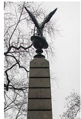
Памятник Борцам за власть Советов