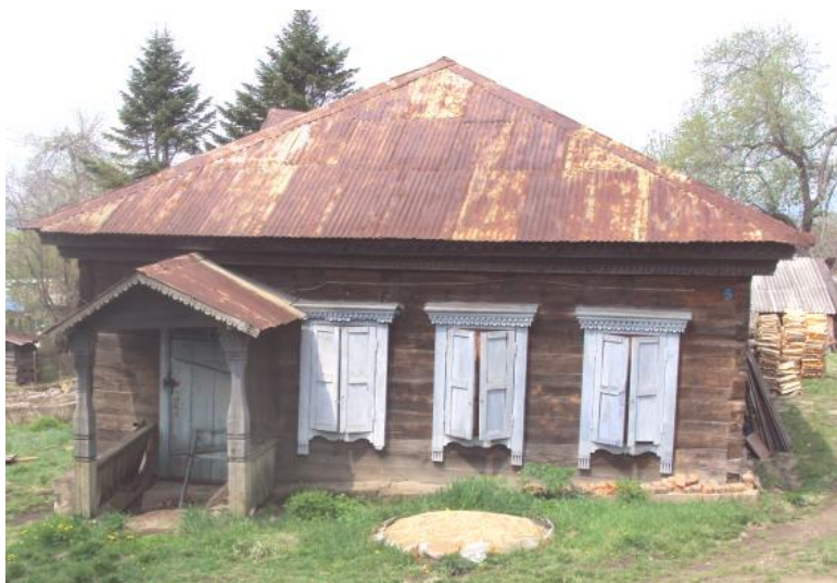
Старый душкинский дом

Старейшее село Душкино Находкинского городского округа находится в 7 км от поселка Ливадия, в котором я проживаю с 1993 года. И очень часто проезжаю мимо Душкино.