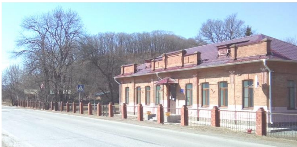
Каменное здание бывшей душкинской школы. Построено в 1909 году.

В селе сохранилось несколько бревенчатых домов, построенных еще в конце XIX века, с резными ставенками, с необычными крылечками. Есть даже дом, в котором сохранилась русская печка и предметы домашней утвари первых хозяев дома. А каменное здание школы, построенное в 1909 году, вообще является визитной карточкой села. До 1935 года была в селе и своя церковь.