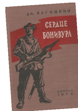
Обложка издания 1953 года