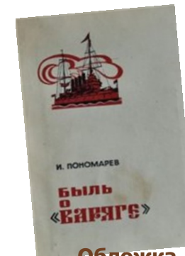
Обложка издания 1948 г.