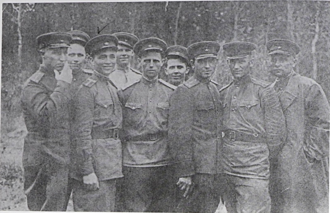
Офицеры Главного управления снабжения Дальнего Востока, 1947 г.