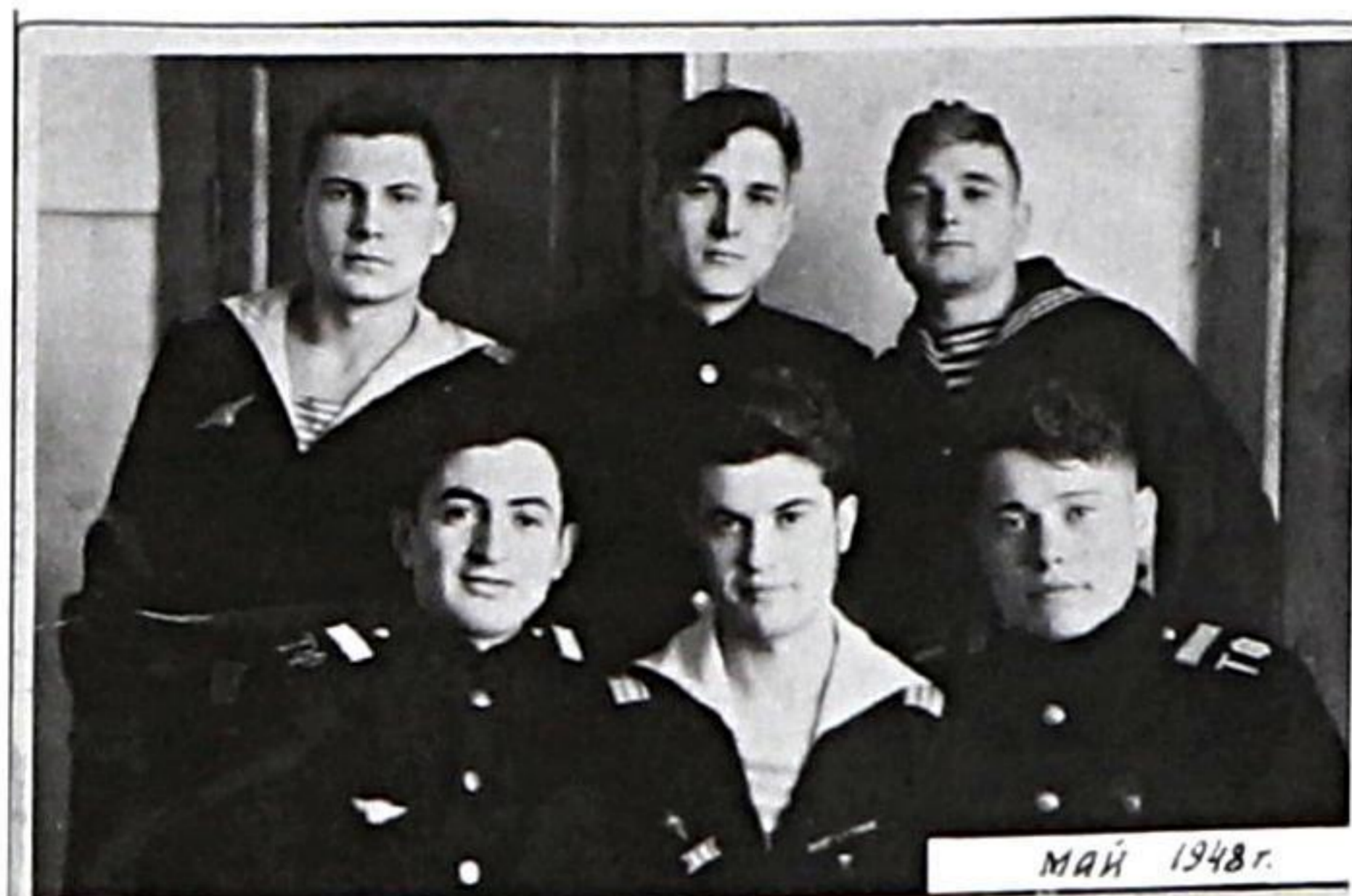
Май 1948 г.

Даже не решаюсь спросить, как живётся сейчас ветеранам Великой Отечественной? Нет ли обид на невнимание, отсутствие заботы?