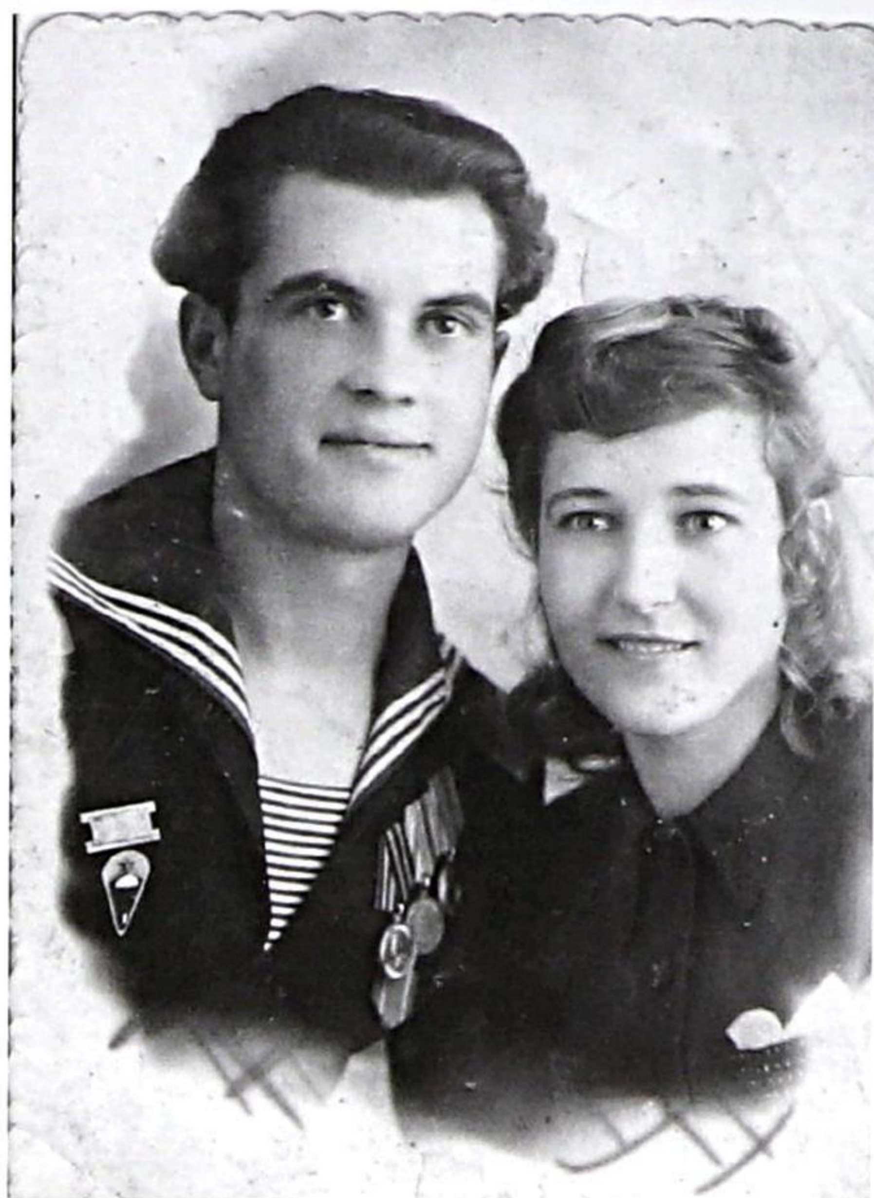
г. Сучан, 21 апреля 1949 г.