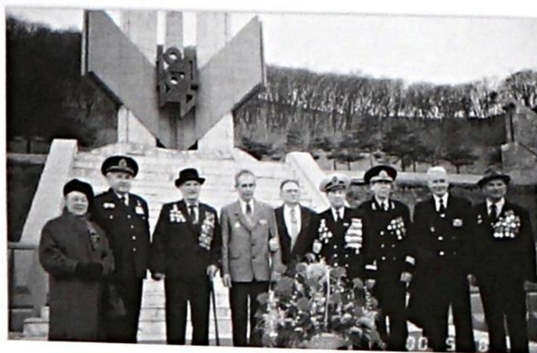
8 мая 2000 г. г. Находка

беды, мы рассказали об этих, полных приключений годах, отданных разведке в партизанском отряде.