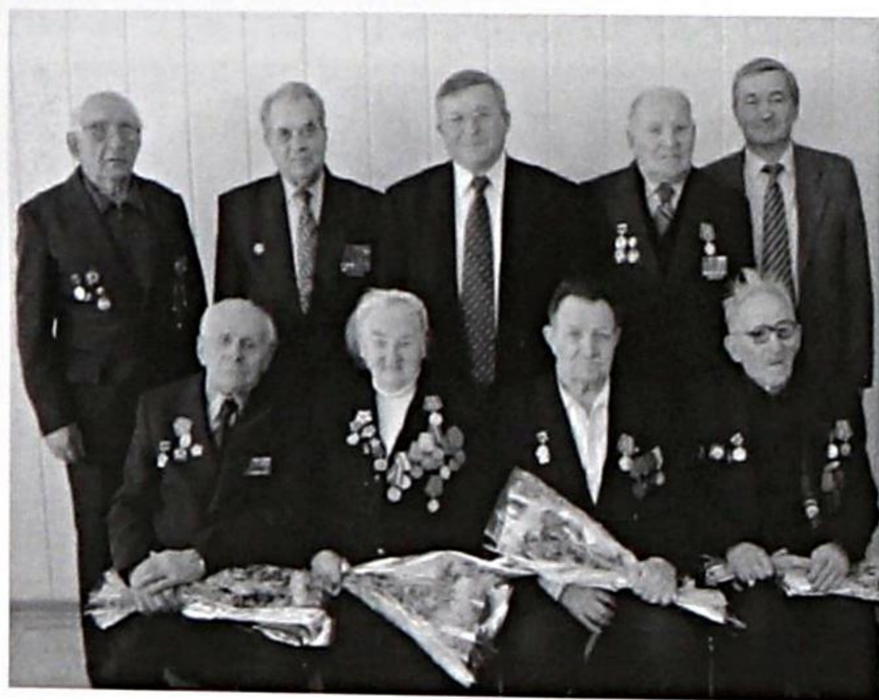
Участники войны, награждённые медалями «За оборону Ленинграда», проживающие в г.Находке на 60-летие снятия блокады Ленинграда, 2004 год