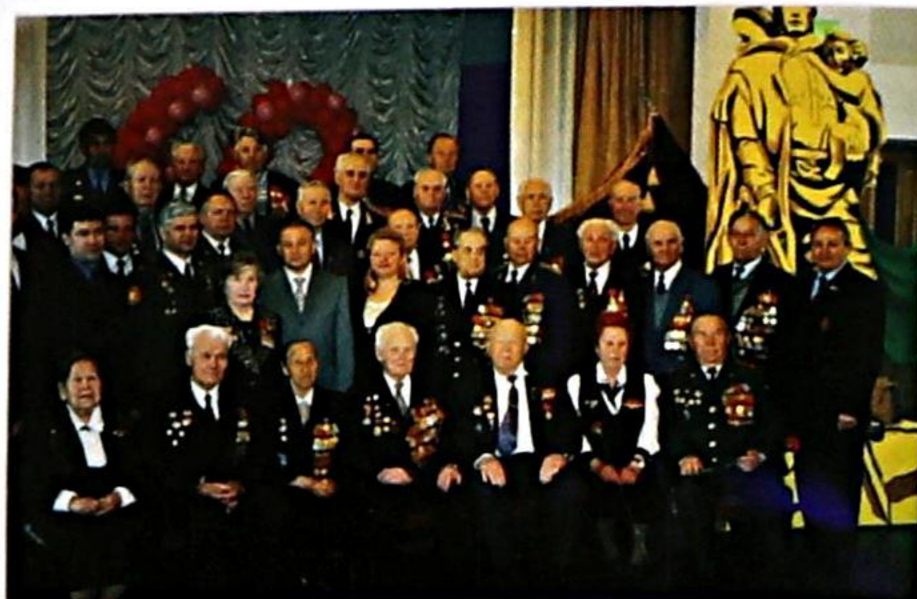
На приеме у главы города Находки 7 мая 2005 года

Да и сегодня не сидится дома ветерану. То приходит на площадь на митинг, то встретил его 22 апреля с цветами Владимиру Ильичу. А чаще его можно застать в комитете Народно-патриотического союза, где он активно, так же, как и всю жизнь, работает.