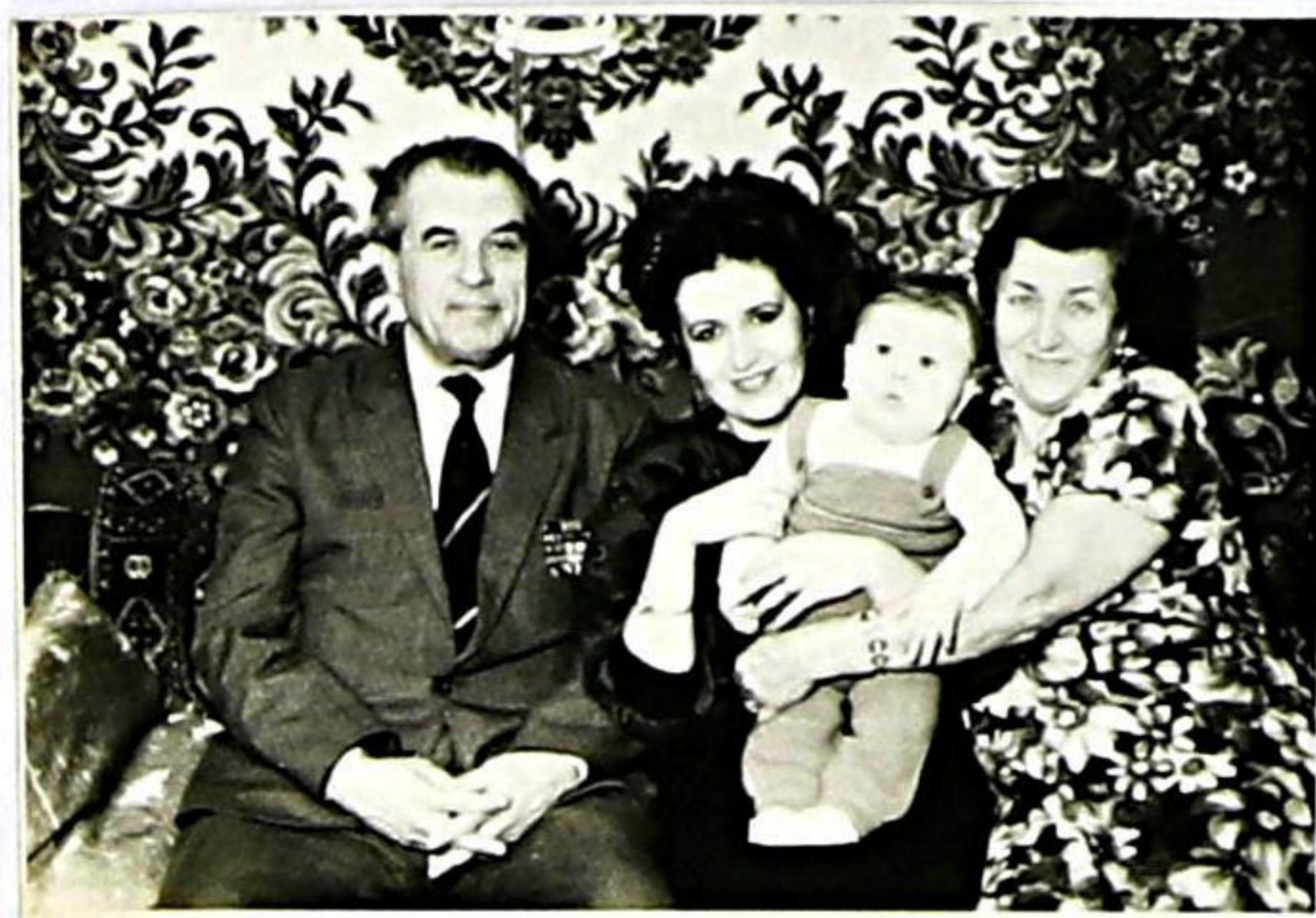
В кругу семьи

алы в бою с жестокими врагами, не раз смотревших смерти в лицо. Пусть мы сейчас не молоды и не плечисты, речь у нас негладкая. Но нам не надо ничего придумывать, мы теряли друзей, получали ранения от вражеских пуль и осколков и всё это не ради долларов и золота. Для нас не было большей награды, чем независимость Родины, счастье любимых и близких людей. А сейчас мы живем тем, что нас помнят, что мы ещё нужны.