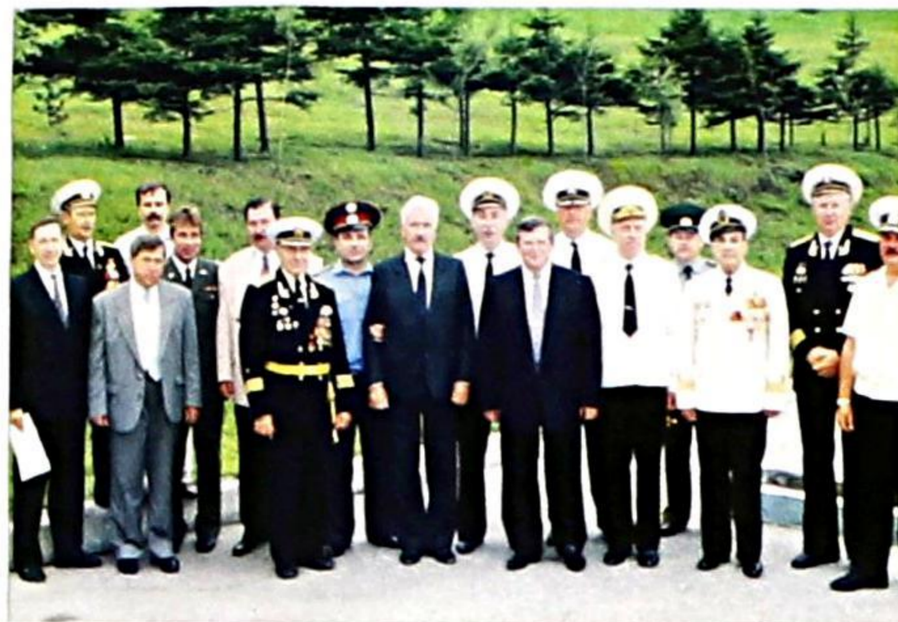
День Военно-Морского Флота и 300-летия Российского флота, 28 июля 1996 г.