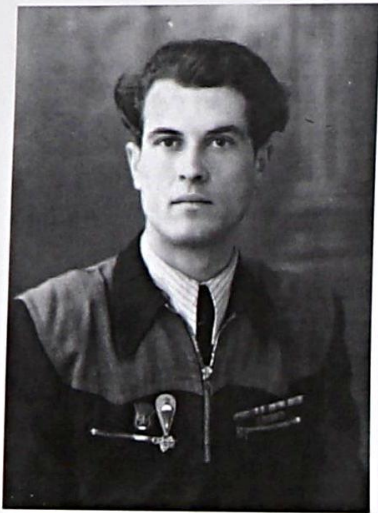
Уволен в запас, май 1950 г.