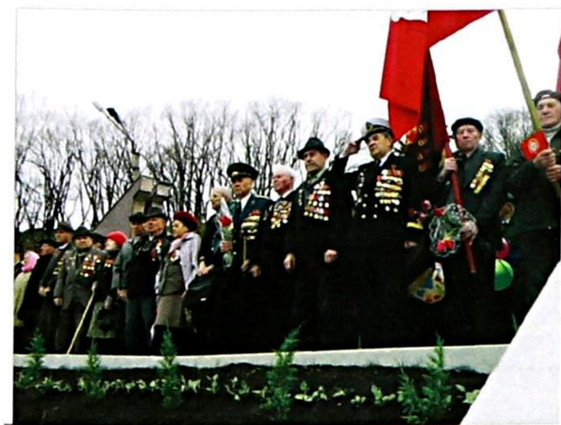
Городской митинг, г. Находка, 9 мая 2005 года 60 лет Великой Победы