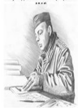
Антуан де Сент Экзюпери (1900 –