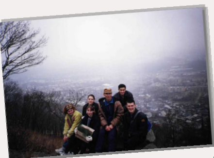
ВСЕМИРНЫЙ ДЕНЬ ЗЕМЛИ В НАХОДКЕ. АКЦИЯ ПОЛСАДКИ КЕДРОВ