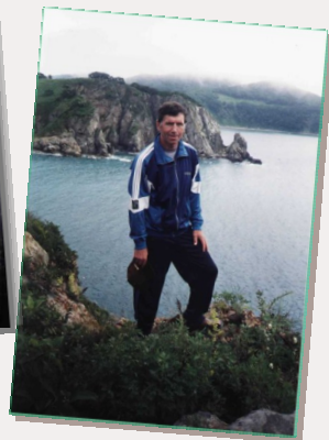
ГЕОЛОГ, ЭКОЛОГ, ПУТЕШЕСТВЕННИК